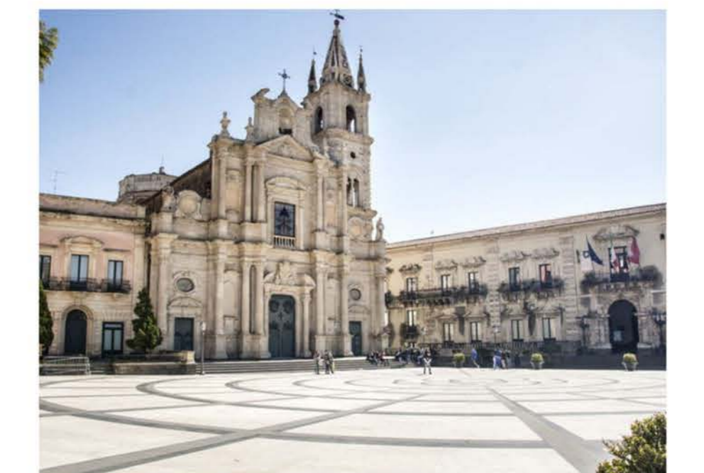
A4 - Santa Maria la Scala Tav. 2 di 2 - Scala 1:500

Art. 3 Legge Regionale 10 Luglio 2015, n.13 (con le modifiche approvate dalla conferenza di servizi nelle sedute del 3 Marzo 2021, 11 Marzo 2021 e 16 Marzo 2021)