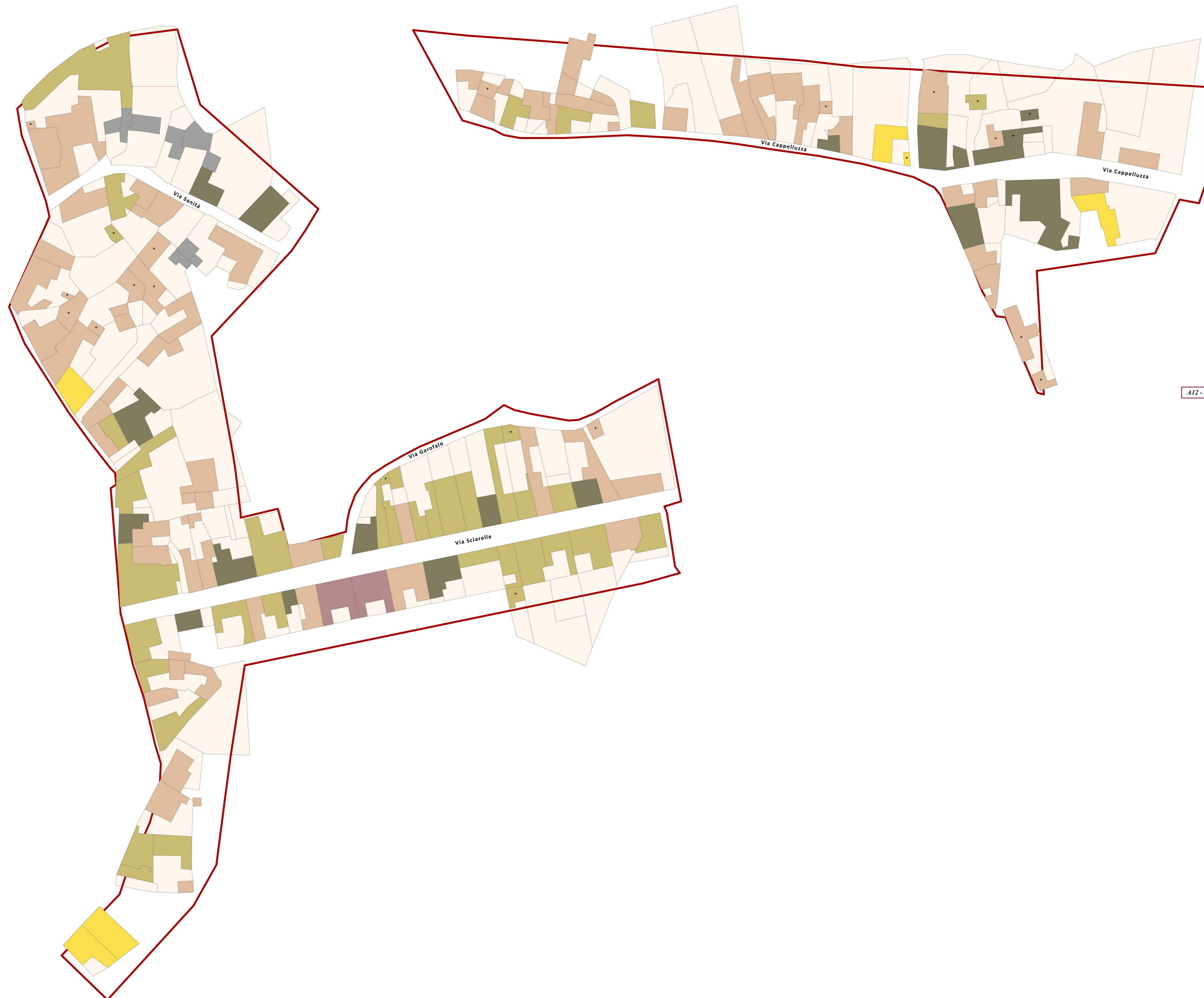
A12 - Aciplatani (porzioni ad ovest)